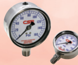
INSTA-FLOW MANOMETROS INDUSTRIALES DE ACERO INOXIDABLE