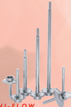
SANI-FLOW TERMOPOZOS SANITARIOS