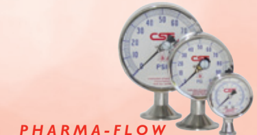
PHARMA-FLOW MANOMETROS FARMACEUTICOS

Le invitamos a visitar nuestra pagina web o solicitar un catalogo para ver nuestra linea completa de alta calidad de nuestros productos de precision que incluyen: Manometros Sani-Flow, Manometros Homogenizadores, Manometros Industriales de Acero Inoxidable, Termometros Digitales, Manometros Pharma-Flow, Manometros Chem-Flow, Cables para Sensor Electronicos, Sensores de Temperatura Sanitarios y Termopozos.