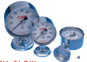
SANI-FLOW MANOMETROS SANITARIOS

Como el mas antiguo y uno de los mas grandes fabricantes de instrumentacion de precision, hemos aplicado nuestra experiencia en el diseo de sobresalientes manometros, termometros y termopozos especificamente para sus aplicaciones. Nuestros instrumentos estan contruidos para resistir los estrictos requisitos de plantas de proceso de alimentos, plantas quimicas y farmaceuticas, y para que funcionen por muchos años con poco o nada de mantenimiento. Nuestro enfoque en la calidad no solo se demuestra en nuestros productos sino en nuestro servicio tambien. Ofrecemos disponibilidad inmediata en todos nuestros productos a precios razonables. Estamos tan convencidos de nuestros productos como de nuestro servicio que ofrecemos una garantia total de satisfaccion.