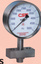
SANI-FLOW MANOMETROS HOMOGENIZADORES